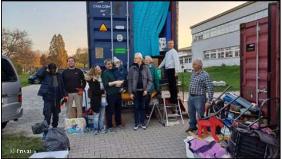
Bei der Arbeit für den Transport in Containern